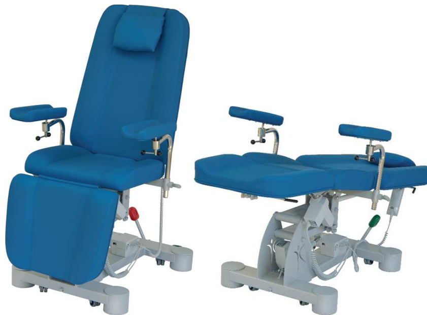
Art.-Nr. IC 21250