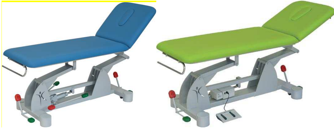
Art.-Nr. IC 14900 und IC 14903